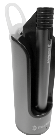
Micro-casque Bluetooth freeVoice Tube