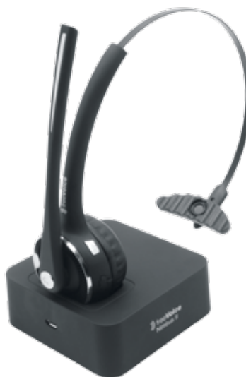
Micro-casque Bluetooth freeVoice Nimbus II

Une nouvelle fois, Apple s'empare de la tendance et la porte au niveau supérieur en dispensant tout bonnement le nouvel iPhone d'une prise pour écouteur. La liaison avec le micro-casque se fait par Bluetooth. Il faut admettre qu'être raccordé, ce n'est pas très branché. Avec les micros-casques freeVoice, vous avez déjà une longueur d'avance et êtes équipé au mieux pour l'avenir.