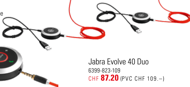
Jabra Evolve 40 Duo 6399-823-109 CHF 87.20 (PVC CHF 109.–)