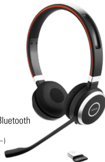
Jabra Evolve 65 Duo NC Bluetooth 6599-829-409 CHF 145.60 (PVC CHF 182.–)