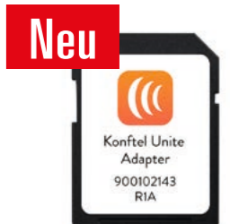
Konftel Unite Adapter 900102143 UVP CHF 49.00

Der Adapter hat das Format einer SD-Karte und wird in den Speicherkartensteckplatz des Konftel 300Wx oder 300Mx gesteckt. Es verwendet Bluetooth LE, um eine drahtlose Verbindung zur Smartphone-App herzustellen (nur zur Steuerung, nicht zur Audioübertragung).