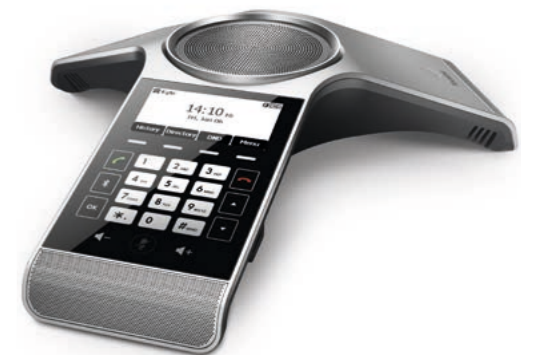
Yealink CP920 SIP SIP-CP920 CHF 594.15 (UVP CHF 699.-)