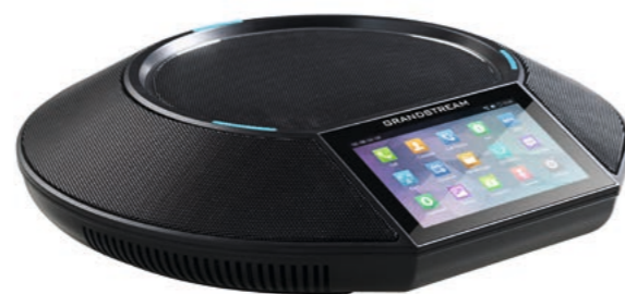
Grandstream Android-Konferenzgerät GAC2500 CHF 398.65 (UVP CHF 469.-)