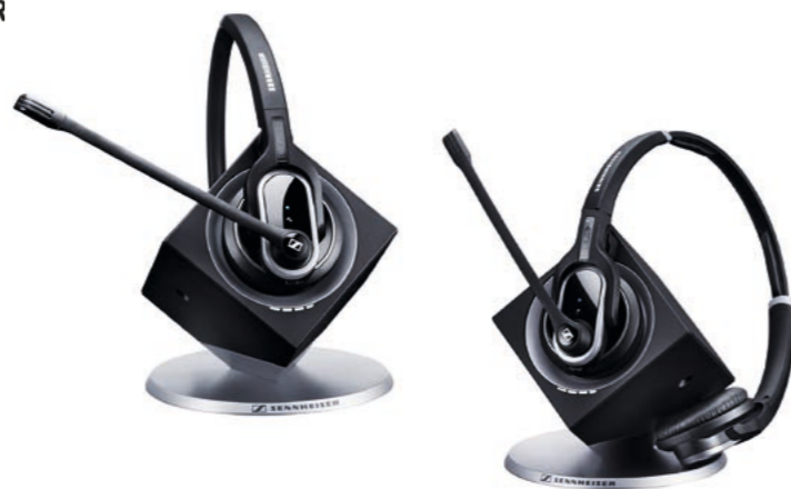
DW20 Pro 1 Mono 504304 UVP CHF 371.00