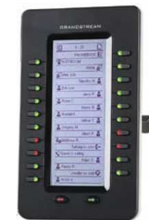
Grandstream GXP2200EXT extension module GXP2200EXT CHF 126.55 (UVP CHF 149.-)