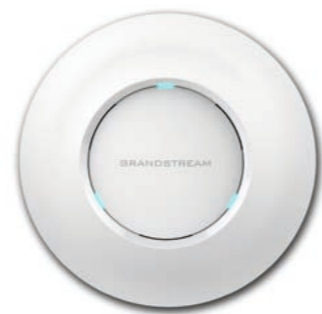
Grandstream high-performance wireless access point GWN7610 CHF 108.00 (UVP CHF 135.-)