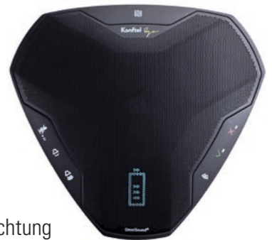
Konftel Ego USB-Freisprecheinrichtung 910101081 CHF 127.20 (UVP CHF 175.-)