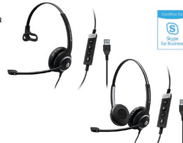
SC 230 USB CTRL II Mono MS 506482 UVP CHF 117.00