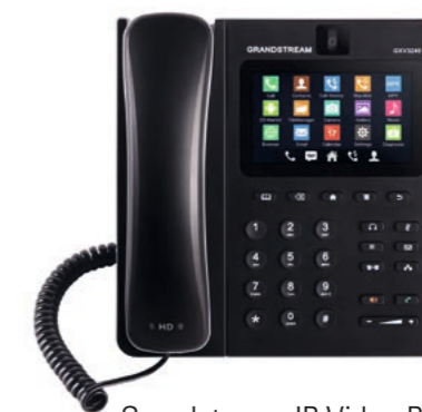
Grandstream IP Video Phone with Android GXV3240 CHF 203.15 (UVP CHF 239.-)