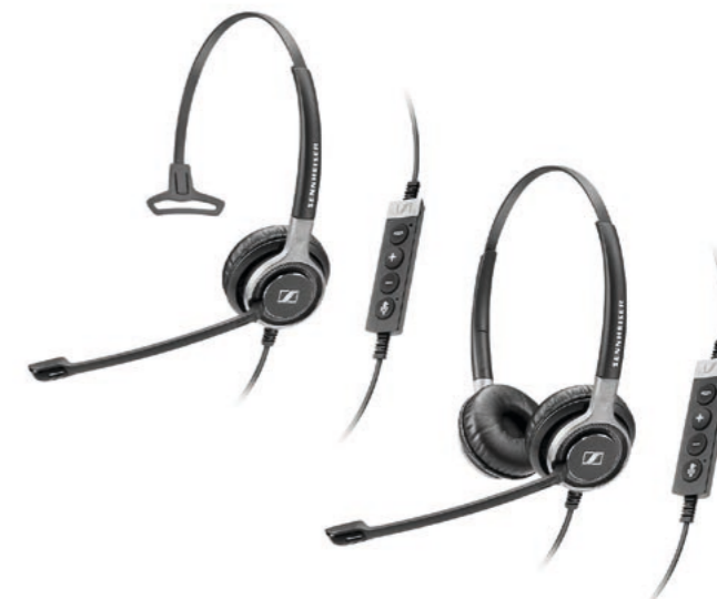
SC 630 USB CTRL Mono 504554 UVP CHF 189.00