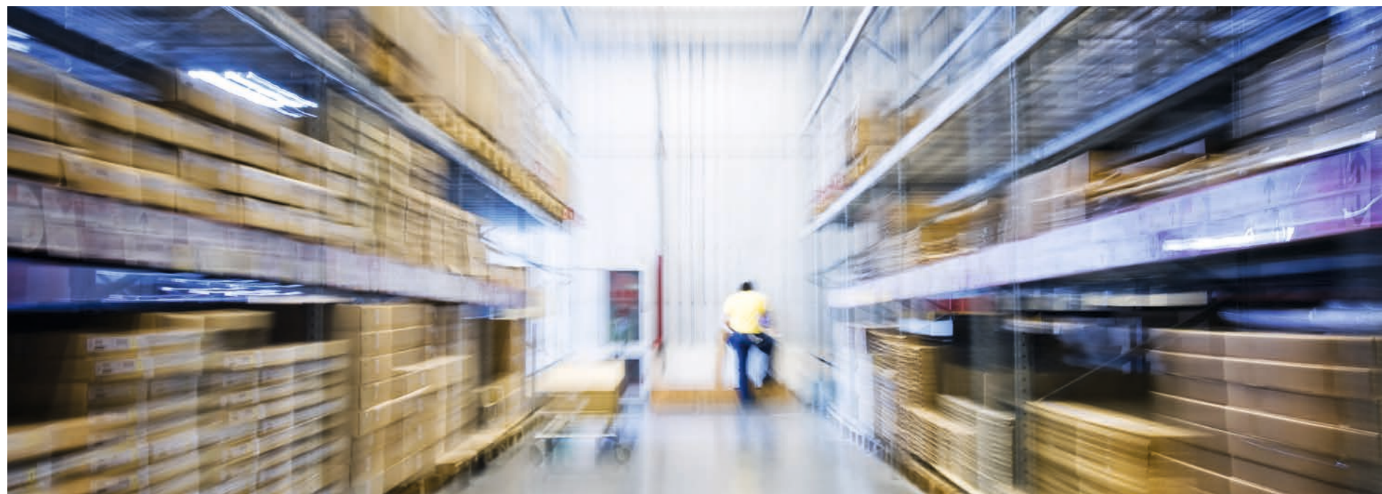
Max Egger CEO Suprag AG

Digitalisierung schön und gut – meistens liegt der Knackpunkt dort, wo es Übergabestellen gibt, bei uns beispielsweise am Packtisch, wo die Headsets und das Zubehör verpackt und der Post übergeben werden. Damit die Waren- und Wertströme optimal funktionieren, muss auch die Ein- und Auslagerung der Produkte optimal funktionieren.