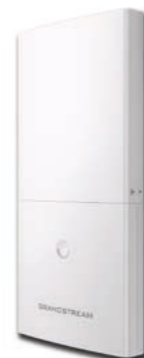
Grandstream long-range wireless access point GWN7600LR CHF 116.00 (UVP CHF 145.-)