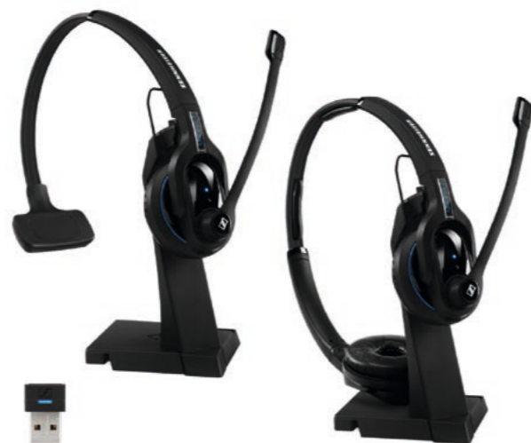
MB Pro 1 UC Mono 506042 UVP CHF 232.00