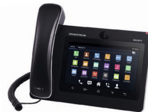
Grandstream IP Video Phone with Android GXV3275 CHF 279.65 (UVP CHF 329.-)